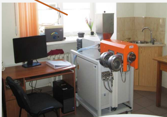
Vienas skrūves laboratorijas ekstrūderis pārtikas produktu ekstrūzija