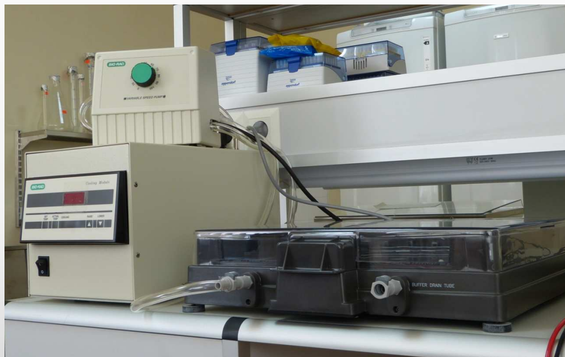
Pulsējošā lauka gēla elektroforēzes iekārta