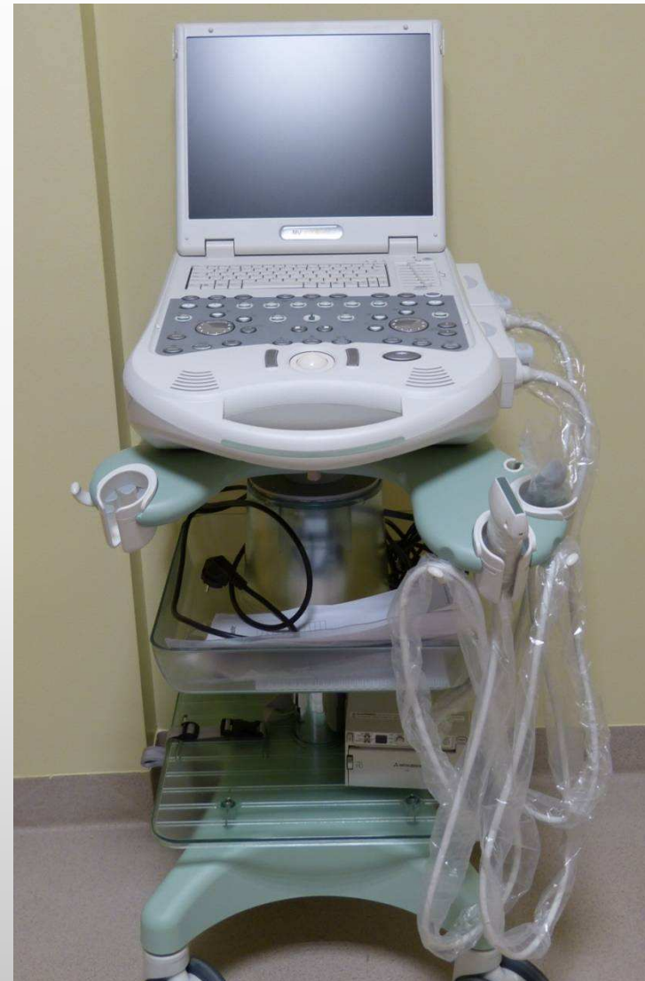
Portatīvā ultrasonogrāfijas iekārta