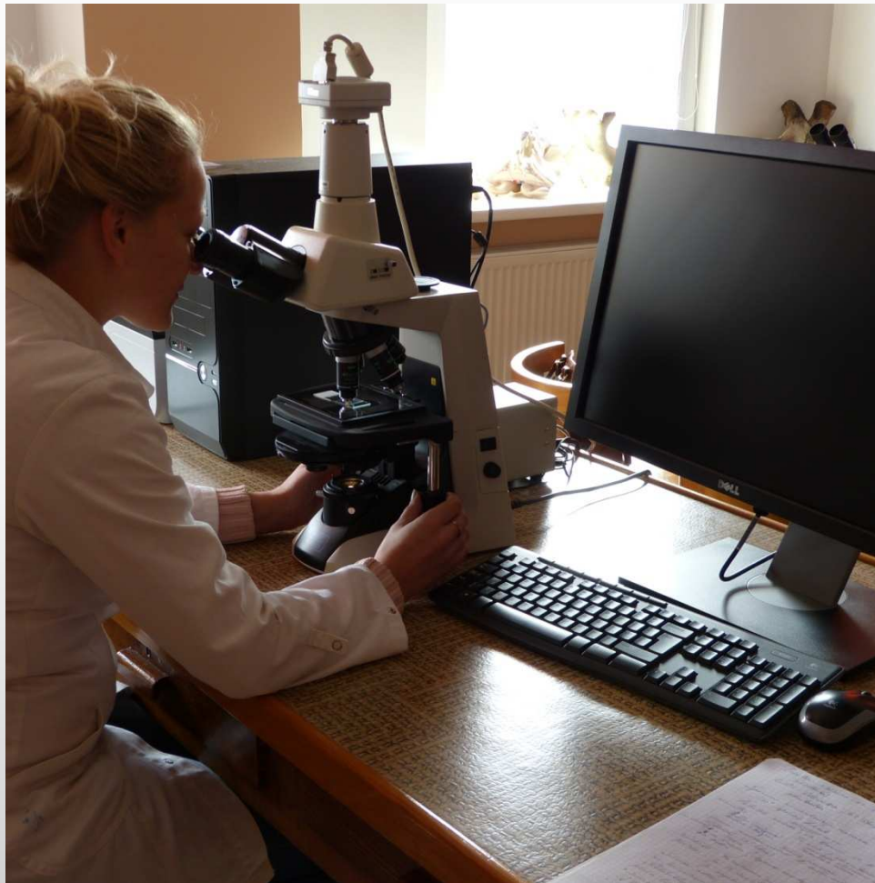
Digitālā kamera kontrasfāzu mikroskopam Nikon E200 + programmatūra