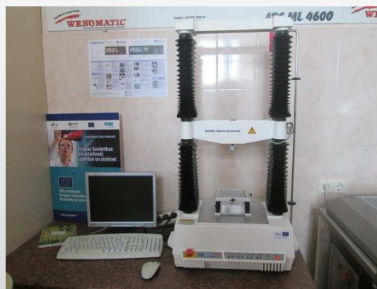
Pārtikas produktu struktūras analizators