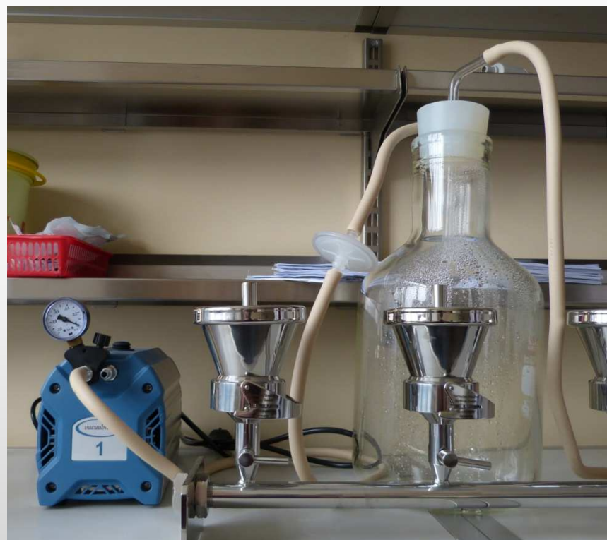
Ūdens membrānfiltrācijas iekārta