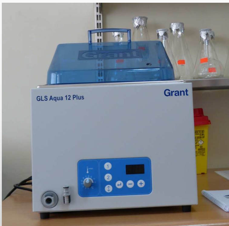
Ūdens vanna ar kratītāju