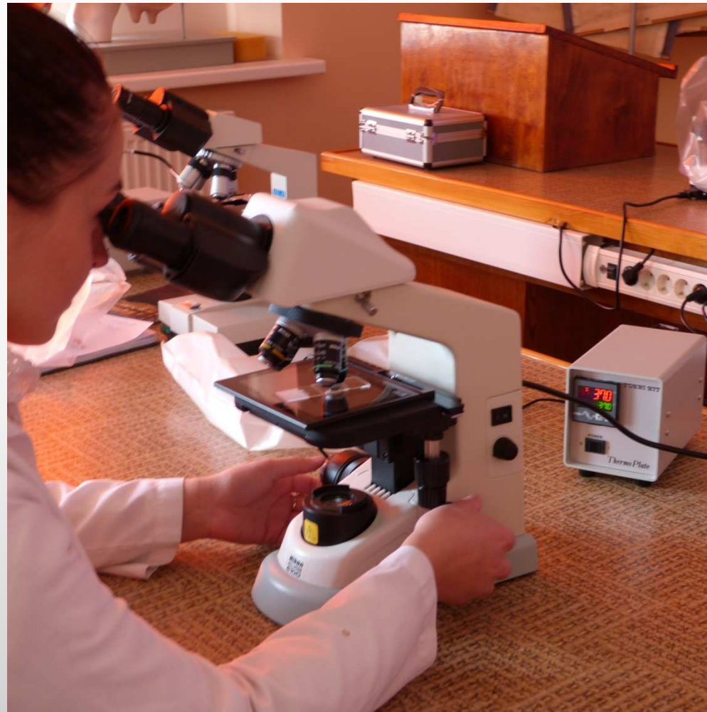
Laboratorijas mikroskops ar apsildāmo galdiņu