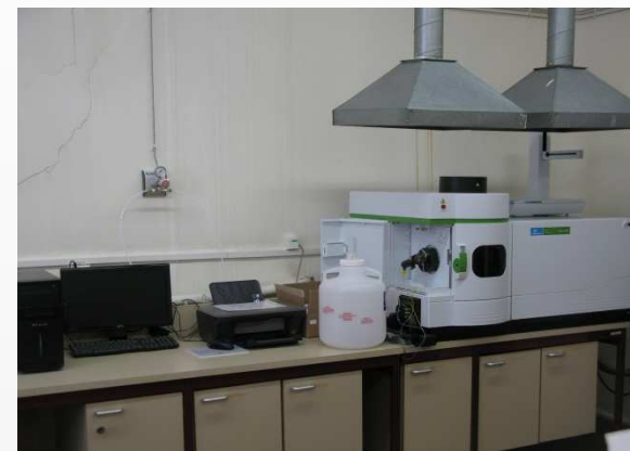
Induktīvi saistītas plazmas optiskās emisijas spektrometrs