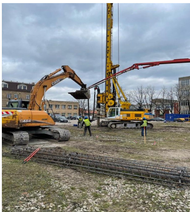
Darbi Dobeles ielā 41, Jelgavā.

Pašlaik notiek būvdarbi trijos objektos – plēves tuneļu būvniecība Dārzkopības institūtā un siltumnīcas pārbūve, bet Jelgavā – Starpnozaru zinātniskās laboratorijas būvniecība Dobeles ielā 41. darbu gaitu visos objektos varētu vēlēties raitāku, diemžēl pandēmija un tās radītās sekas nopietni ietekmē materiālu piegādi un projektā nāksies lūgt pagarinājumu, jo jau pašlaik skaidrs, ka vienu objektu nevarēs nodot plānotajos termiņos.