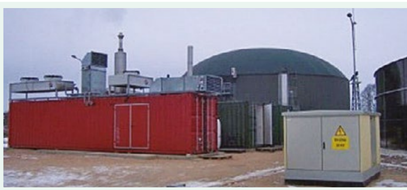
Biogāzes stacija LLU MPS "Vecauce"