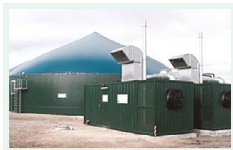
Liellopu šķidrmēsļu pārstrādes stacija ZS "Mežaciņņi"

Kūtsmēsļu fermentācijas biogāzes reaktorā mērķis ir nodrošināt efektīvu kūtsmēsļu apsaimniekošanu un vērtīga mēslojuma ražošanu lauksaimniecības kultūraugiem, kā arī samazināt SEG emisiju līdz minimumam liellopu, cūku un putnkopības saimniecībās.