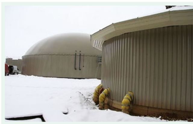
AS "Agrofirma "Tērvete"" liellopu kompleksa biogāzes radīto siltumu izmanto alus brūzī un ciemata apkurei.