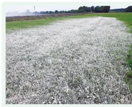
Izkliedēti kaļķakmens milti.

māla augsnēm izskalojas 200–250 kg ha -1 , no smilts augsnēm 450–500 kg ha -1 CaCO 3 , iznesa ar kultūraugu ražu, vidēji ap 60 kg ha -1 CaCO 3 , bet minerālmēsļu radītā skābuma neitralizācijai nepieciešamais CaCO 3 daudzums atkarīgs no minerālmēsļu veida un lietošanas intensitātes.