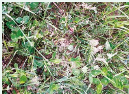
Rupja maluma dolomīta miltu izkliede un izkliedēti rupji malti dolmīta milti.