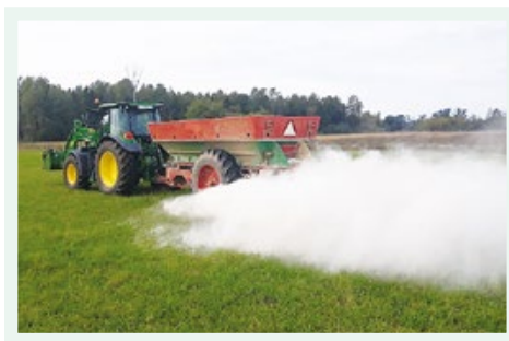
Kaļķakmens miltu izkliedēšana.

šana arī tad, ja augsne bijusi ļoti skāba un ar veikto pamatkaļķošanu netiek sasniegta optimālā augsnes reakcija.