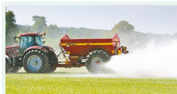
Sijāta kaļķakmens izkliede

jas, gan denitrifikācijas rezultātā. Latvijas apstākļos denitrifikācijas procesa rezultātā par N_2O un N_2 pārveidojas 10% no augsnē esošā minerālā slāpekļa. Zinātnisko pētījumu rezultāti liecina, ka augsnes pH palielināšana samazina N_2O emisijas no skābām augsnēm arī stipru lietusgāžu periodos, kad emisijas rada nitrifikācija. Ir pierādīts, ka kaļķošana nodrošina siltumnīcefekta gāzu emisiju samazināšanos saimniecībās, jo samazinās N_2O plūsma.