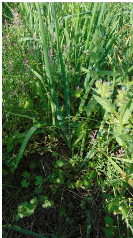
3.attēls. Salmu mulča sīpoliem

Zaļmēslojuma variantā rudzu augi tika sasmalcināti un iestrādāti augsnē 2.jūnijā. Arī dzīvās mulčas sedzējaugu (ASC) variantā rudzi tika aizlauzti ar lauzējveltni 2.jūnijā. Rapšu augi tika iearti nepietiekamās zaļmasas dēļ un tā vietā ierīkoti divi mulčas varianti – salmi un āboliņš, kur nopļauta augu biomasa izklāta starp rindām veidojot mulčas slāni (3., 4.att.).