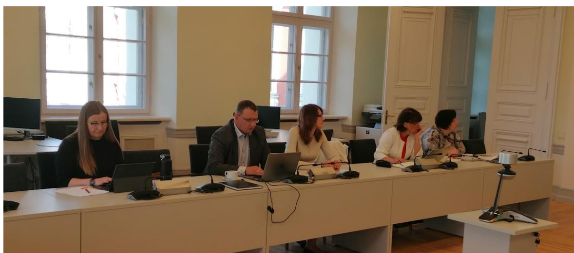
Ekspertu sēde 06.06.2022.