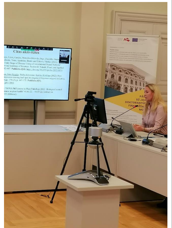
Ekspertu sēde 14.11.2022.